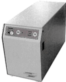
Фотография: внешний вид хроматографа исполнения 1

Хроматограф исполнения 2 отличается от исполнения 1 несущей конструкцией, т.к. предназначен для встраивания в стойку, и питанием только от сети переменного тока напряжением 220 В. Может использоваться в передвижных лабораториях, не работающих на ходу.